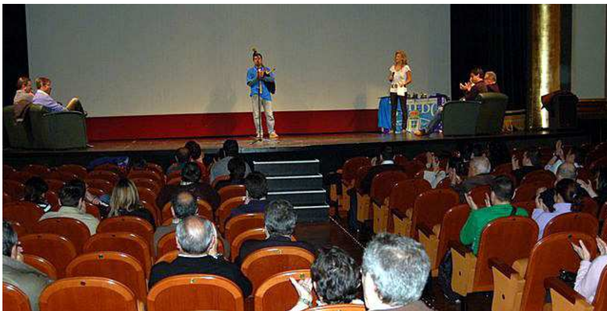
momento en el que tras escuchar el himno oviedista se procedió a la presentación del acto

el evento pudiese celebrarse, así como a los espectadores su presencia.