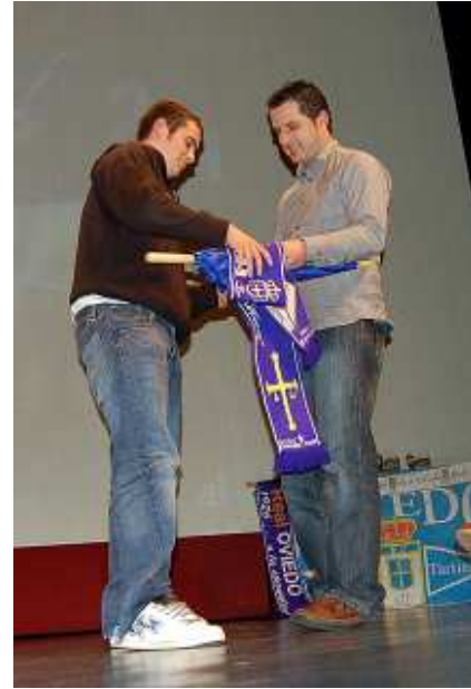
momento en el que les son entregados a los afortunados diversos obsequios que se habían sorteado

podía haber incluso puesto en peligro la permanencia en 1ª división. Y es que, pese a que el encuentro cuyas imágenes se estaban proyectando eran las del partido de ida en el Carlos Tartiere, los comentarios aludiendo al de vuelta en el Luigi Ferraris genovés fueron recurrentes.